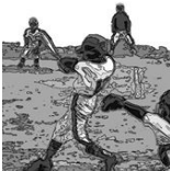
我孫子市少年野球